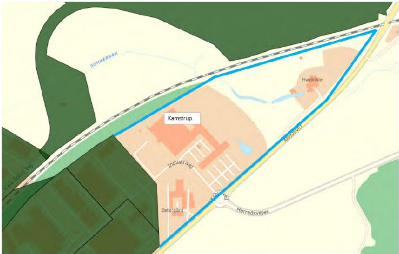
Figur 3 Område med eksisterende fjernvarmeforsynet storforbruger som inddrages i forsyningsområdet.