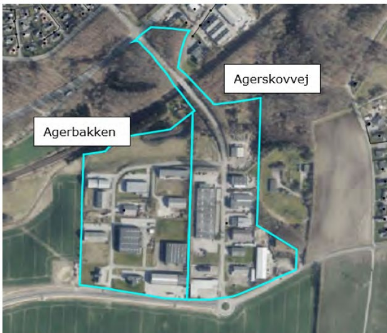
Figur 2 Nyt forsyningsområde Agerbakken og Agerskovvej.